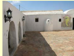
FOTO DEL MUSEO DI SMAR IL GIORNO DELLA INAUGURAZIONE IN PRESENZA DEL GOVERNATORE DI TATAOUINE